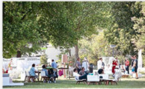
In anregender Atmosphäre können Besucher das Design erleben und ausprobieren. Die Design Days verbinden gekonnt Aufweis und Wohlfühlen.