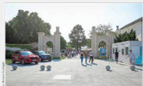
Bei den Design Days in Grafenegg von 12. bis 14. Mai wartet ein großer Mobilitätsschwerpunkt auf die Besucher.

Kaum ein Objekt in unserem Alltag besitzt so viel Symbolcharakter wie das Auto. Fortschritt und Freiheit, Komfort und Technik, Design und Lifestyle – all das trifft sich dann. Alles Dinge, die auch bei den Design Days Grafenegg – der größten heimischen Outdoormesse für Wohn-Design, Living und Lifestyle – eine wesentliche Rolle spielen. Und was liegt da näher, als der Mobilität auch einmal einen besonderen Schwerpunkt zu widmen: Kia, Volvo, Audi, Jaguar, Land Rover, Cupra, Alfa Romeo und DS Automobile – sie alle haben ihre eigene unverkennbare Designidentität, die man in Grafenegg hautnah erleben und erspüren kann. Präsentiert wird eine Bandbreite an neuen Modellen. Vor allem bei der Volvo-Produktlinie (XC40, XC60, XC90, V50 und V90) im Gepäck – und lädt dazu ein, diese im entspannten Setting bei einer Probefahrt näher kennenzulernen. Auch bei KIA ist dies möglich, zur Testfahrt bereit stehen der KIA Sportage, der EV5 sowie der Niro EV. DS bietet an, den DS4 wie auch den DS7 bei einer Ausfahrt näher kennenzulernen und bei Platz nehmen dürfen. Mehr Informationen zu Programmen und Ausstellern gibt es auf www.design-days.at